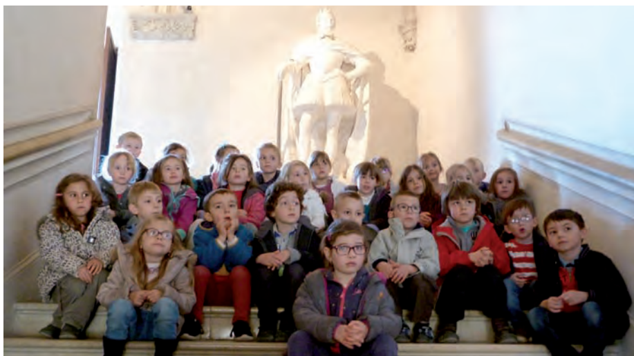
Visite du Château de Pau

Cycle « piscine » pour les CP/CE1 au mois de juin, visite château de Pau et projet-portait à la maison Baylaucq, initiation aux quilles de 6 (CE2 et CM1), voyages scolaires au château de Mauvezin et au musée de la mer de Biarritz, participation à Jazz In School pour les CM2 avec les élèves de 6e du collège Jean Bouzet.