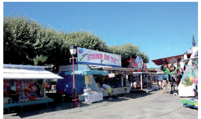
Fêtes de la Saint Laurent 2016