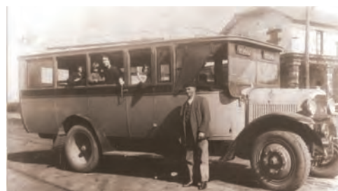
Premier Bus de la ligne Pau/Pontacq après le tram.

Dans la vallée de l'Ousse et particulièrement à Pontacq aussi cette ligne aurait été la bienvenue, elle aurait permis le développement de l'économie chancelante (artisanat et agriculture) de notre vallée, elle aurait aussi incité les industriels à s'implanter plus facilement dans notre commune. On peut lire dans un rapport de Jean Clouchet du 18 août 1855, un état des lieux économique de notre commune. Malheureusement, le Conseil d'Administration des Chemins de Fer du Midi, délibéra en faveur de la vallée du gave de Pau et le premier train circula le long du gave en 1867 (1).