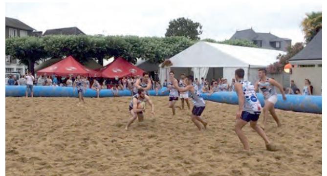
Beach rugby 2016