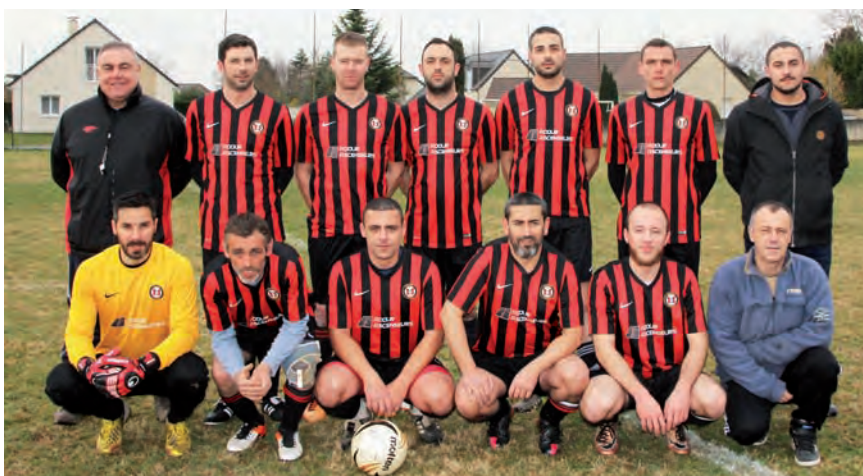
L'équipe de foot à 7 qui a, jusqu'à ce jour, accompli un beau parcours.

La formation de foot à 7 caracole en tête de sa poule en pratiquant un football plaisant et collectif. Elle devrait en principe participer aux phases finales.