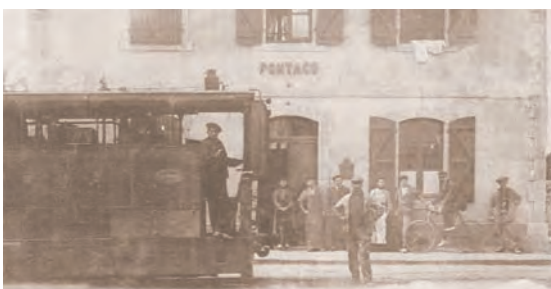
Devant la gare de Pontacq en 1904

Quelques années plus tard, notre commune qui bénéficiait d'une expansion industrielle importante, avait un besoin pressant de moyen de transport. Une nouvelle chance se présentait dans le cadre du réseau ferré secondaire. En 1890, parmi les lignes proposées, la commission des tramways retenait la ligne de Pau à Pontacq. Elle fut déclarée d'utilité publique le 4 avril 1896, fut ouverte au trafic des voyageurs d'Espoey le 10 novembre 1901 et de Pontacq le 3 février 1902. Véritable trait d'union entre le chef-lieu de canton et Pau, desservant toutes les communes situées sur son passage, ce nouveau moyen de locomotion reliait également les