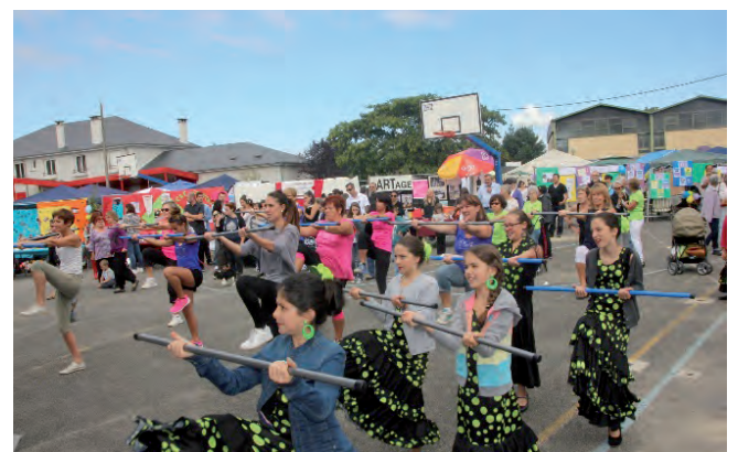
Journée des associations 2016