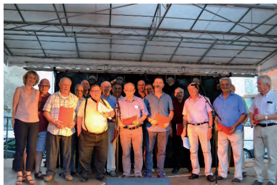
Fête de la Musique – Les Chœurs d'Hommes

Venez nombreux pour profiter des différentes manifestations organisées pour votre plus grand plaisir !