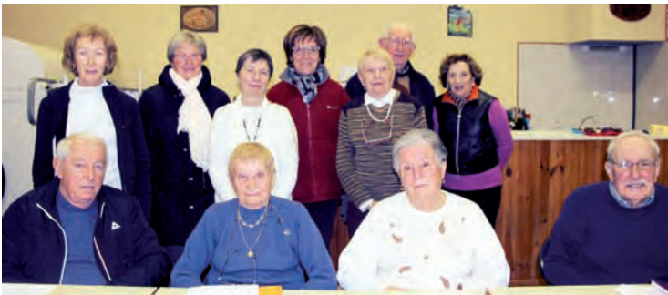
Les membres du bureau et du conseil d'administration du Groupe Vocal Ousse Bigorre lors de leur assemblée générale.

Le groupe continuera à animer des cérémonies religieuses, des goûters, des concerts et autres événements. Les répétitions ont lieu le mardi, à 20h30, à la salle « La Ritournelle », à Lamarque-Pontacq et les nouveaux choristes y seront accueillis avec joie.