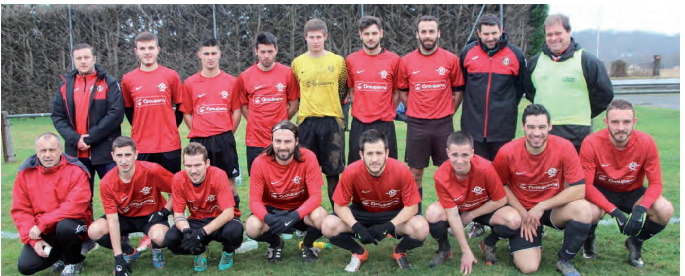
L'équipe 1 peut espérer terminer en bonne place au classement de sa poule ».

prétendre se retrouver à la tête de ce groupe. Il convient ici de remercier les dirigeants, les entraîneurs et les éducateurs pour leur implication, mais aussi les joueurs pour leur chic esprit, sans oublier les parents qui encouragent les jeunes de l'école de foot et assurent leur transport lors des déplacements. Merci aussi aux généreux bienfaiteurs lors de la tournée des calendriers.